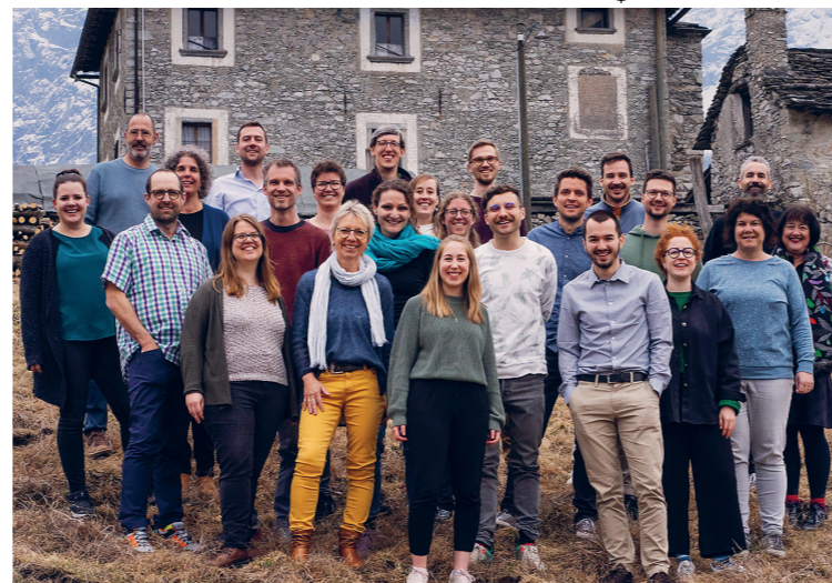
Die angestellten Mitarbeitenden der VBG im Frühling 2023

Martin: Auf ruhigere Rahmenbedingungen und genügend Spenden, damit wir uns voll auf die Menschen konzentrieren können. Im Fokus steht dabei unser Kernanliegen: Glauben, Denken und Alltag zusammenbringen, sodass Menschen im Bereich der höheren Bildung einen tragfähigen christlichen Glauben entwickeln können. Einen Glauben, der in das persönliche und gesellschaftliche Umfeld ausstrahlt. Darum geht es, dafür ist die VBG da!